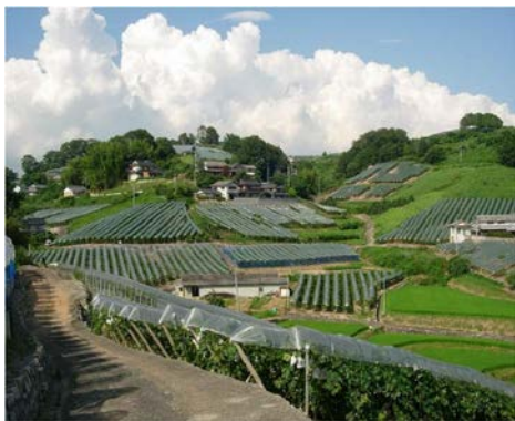
温暖な気候に恵まれ、一面に広がる ぶどう畑