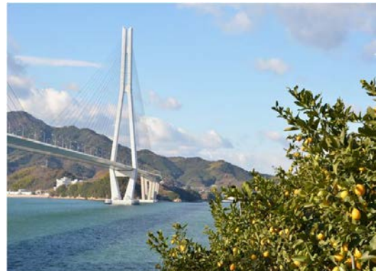
瀬戸内の温暖な気候に育まれる 備後圏域（尾道）産レモン