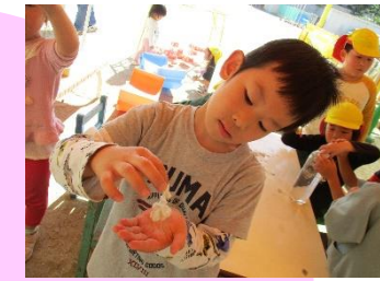
5歳 「自分で育てた綿ができて嬉しい！」