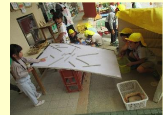
5歳 ドングリ転がし 「もっとこうしてみたらいいんじゃない？」