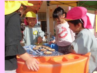
4歳 BBQ ごっこ ～自然物を色々な食材や道具に見立てて～