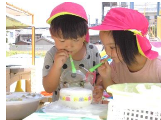
4歳 しゃぼん玉遊び 「一緒に吹こう！」「せーの…」