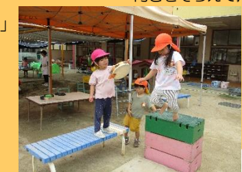
3歳 運動遊び 「もっともっと高くして～！」