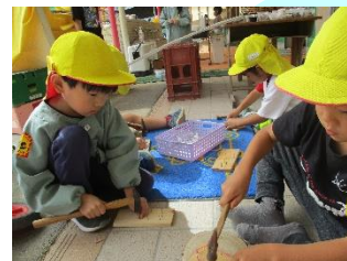
5歳 木工遊び ～夢のステージ作りに向けて～