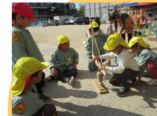
5歳 焼き芋パーティー 「煙が出てきた！」「もうちょっと！」