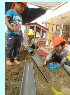
3歳 砂場遊び ～土をジャーって流そう！～