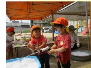
3歳 泡遊び 「もっともこもこの泡にしよう！」