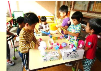
4歳 お店屋さんごっこ 「次はどんな味にしようかな？」