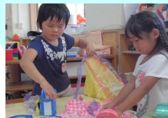
4歳 アイドルごっこ 「アイドルってフリフリのスカートなの♪」