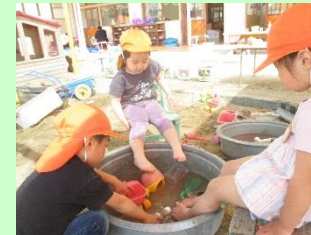
3歳 落ち葉遊び 「足湯、気持ちいいね♪」