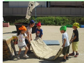
5歳 海賊サーキット遊び ～同じ目的をもって友達と協力して準備～