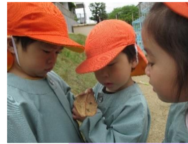
3歳 「ダンゴムシさん、 葉っぱのお家に入れてあげよう」