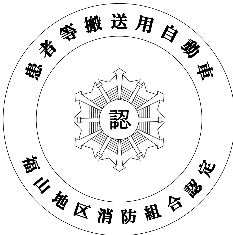
別図第2（第23条関係） 患者等搬送用自動車認定マーク

患者等搬送用自動車認定マークは、自動車後面であって運転者の視野を妨げない見やすい位置に貼付するものとする。