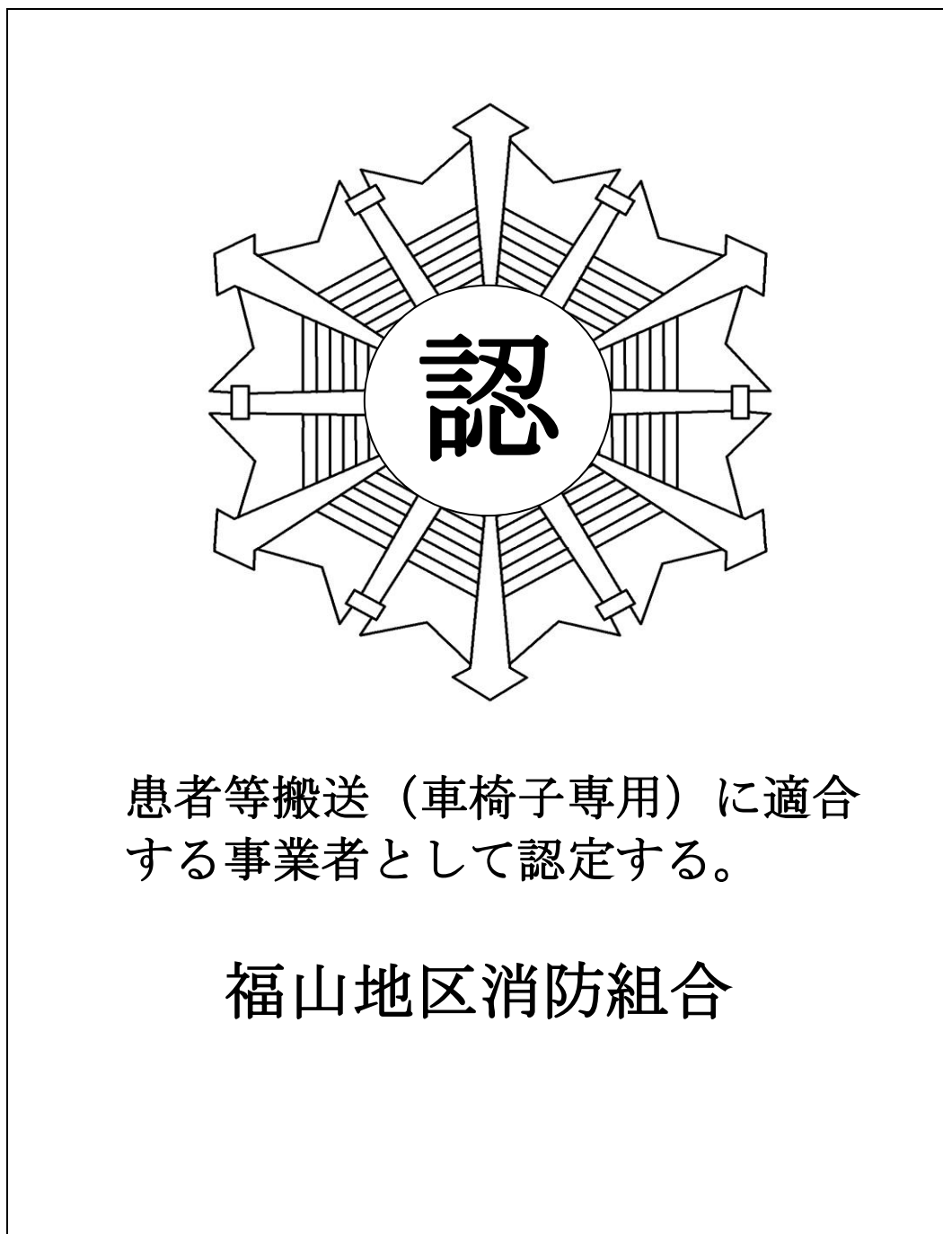
別図第3（第23条関係） 患者等搬送事業者（車椅子専用）認定マーク