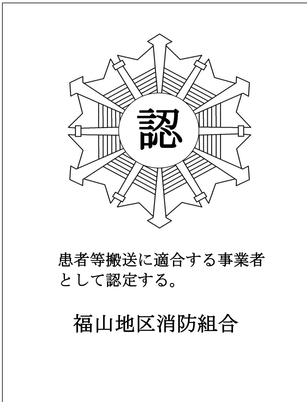
別図第1（第23条関係） 患者等搬送事業者認定マーク