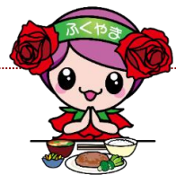
ばらのまち福山イメージキャラクター 「フレイル予防ローラ」

※締め切りは、実施日の1週間前までとさせていただきます。お早めに申込みをお願いします。