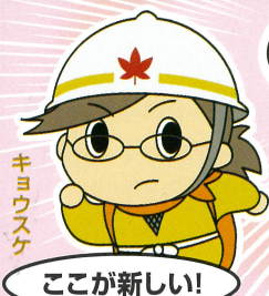
広島県防災キャラクター タスケ三兄弟

よりわかりやすく、よりくわしく 災害から命を守るために欠かせない情報が届きます!