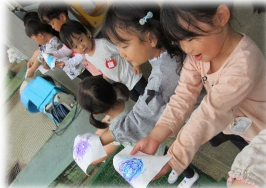
「雨が降ってきたよ～」 「紙に塗った色が雨で溶けてジュースになったよ」