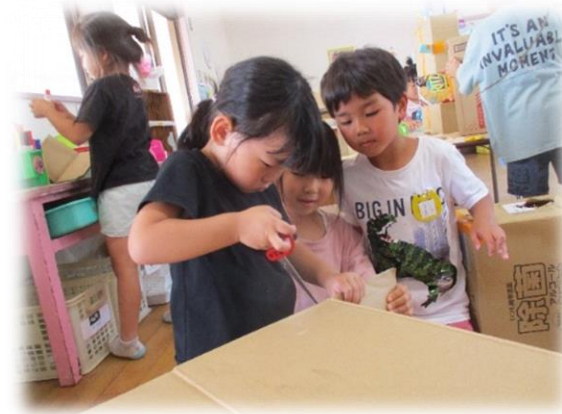
「ここを持って！」「いいよ～」 「大きな段ボールが切れた。やったね」