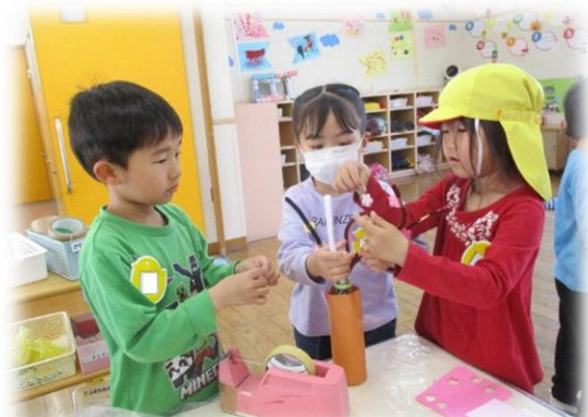
「ここに桜の花をつけて、大きな桜の木にしよう」