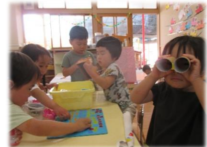
「見える見える 友だちがいっぱい見える」