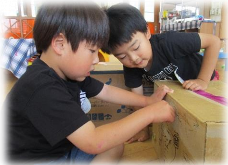
「こっちに繋げたら 車みたいになるよ」