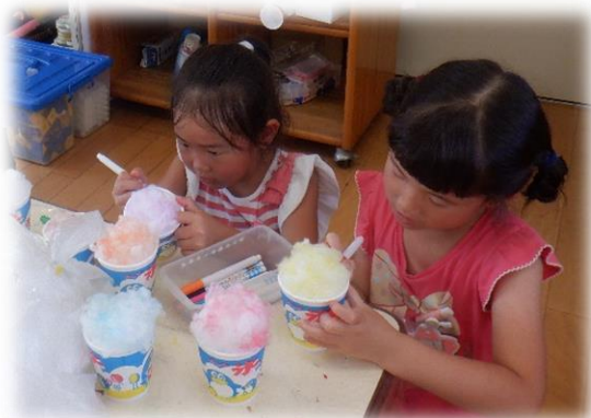
「こうやってトントンって塗ったら、本物のふわふわかき氷に見えるね！」