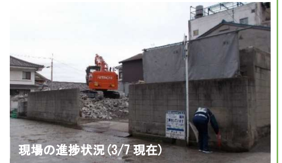
現場の進捗状況(3/7現在)