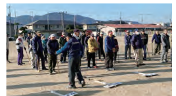
[秋季グラウンド・ゴルフ大会]