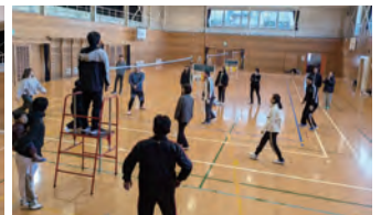
[ソフトバレーボール大会]