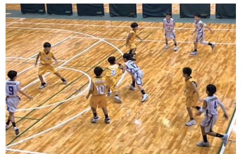
[JFEスチールCUP4年生以下大会]