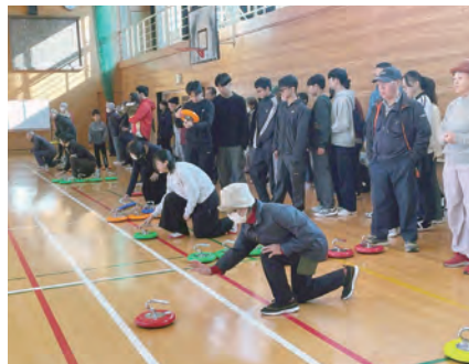
[カラーリング大会]