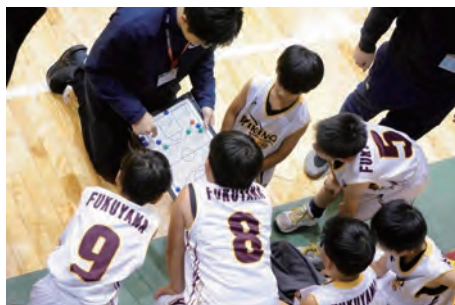
[JFEスチールCUP4年生以下大会]

旭丘学区では地域交流や住民の健康維持、促進を目的とし、各町内会や団体でモルックやグラウンド・ゴルフ、ボウリング大会など様々なスポーツを行っています。来年度以降もさらなる地域活性化に尽力していきたいと思えます。