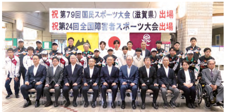
社行式(福山市役所1F) 2025年(令和7年)10月