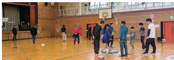
[あけぼのスポーツフェスティバル]

これからも地域の皆さんが、スポーツを通じて楽しく交流出来るコミュニケーションの機会を提供出来るよう活動していきたく思ひます。