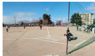
[ソフトボール大会]