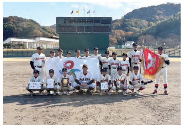
[優勝 松永ヤンキース]