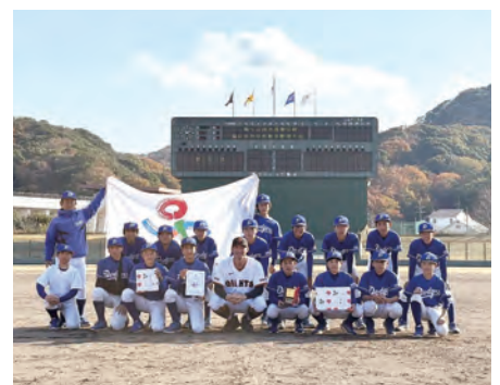
[3位 福山ドジャース球団]