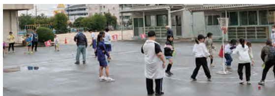
[あけぼのスポーツフェスティバル]