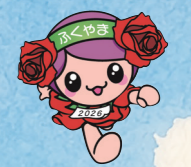
ばらのまち福山 イメージキャラクター「ローラ」