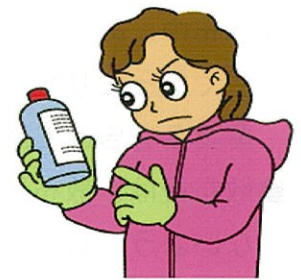
農薬ラベルを確認