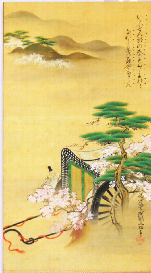
阿部正福筆「桜花図」(個人蔵)