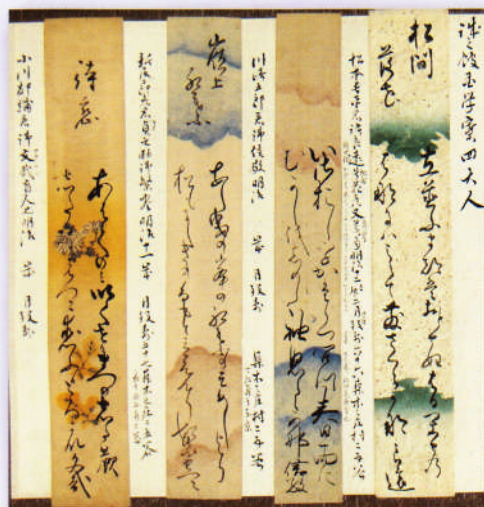
藩校誠之館国学寮四大人短冊(個人蔵)