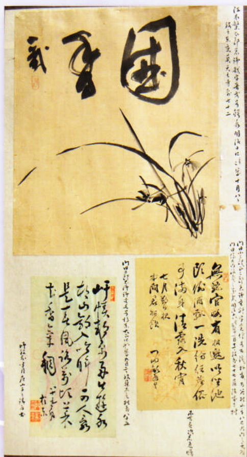
江木鯛水・門田朴斎・門田杉東筆料紙(個人蔵)

福山城築城390年を記念して福山藩ゆかりの儒者・学者、絵師などの書跡や絵画を展示して、江戸時代の学問・文芸がどのように発展したかを紹介します。