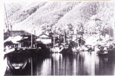
明治末期ごろの入り江と福山城