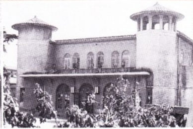
1926年(大正15年)完成した公会堂