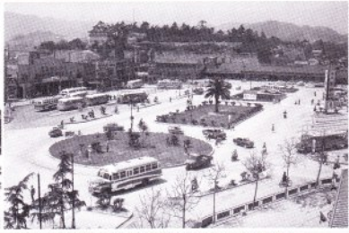
1961年(昭和36年)福山駅前の風景

日時:2011年6/4(土)～8/7(日) 9:00～18:30 (入館は18:00まで) 月曜日休館 ※7/18(祝)は開館 7/19は閉館