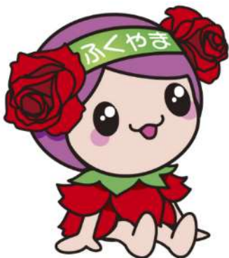
ばらのまち福山 イメージキャラクター「ローラ」